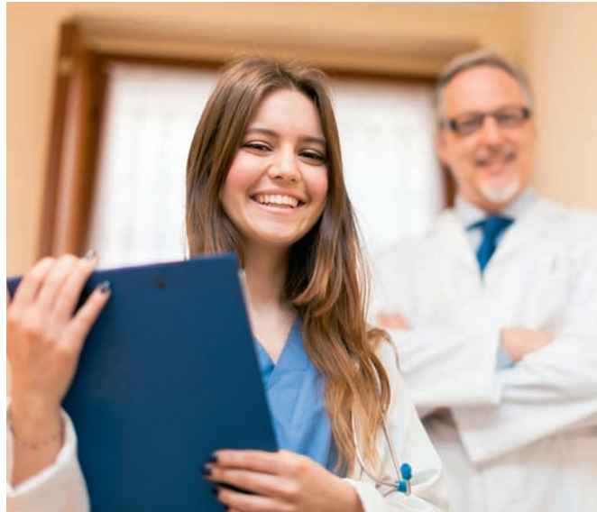
Große Erleichterung: 40 Lehrpraxisstellen pro Jahr werden ab nun finanziert.

Denn in Oberösterreich werden in den kommenden zehn Jahren etwa 380 praktische Kassenärzte in Pension gehen. Jährlich wären 38 bis 40 Nachfolger notwendig, um den Ist-Stand zu halten. Doch derzeit