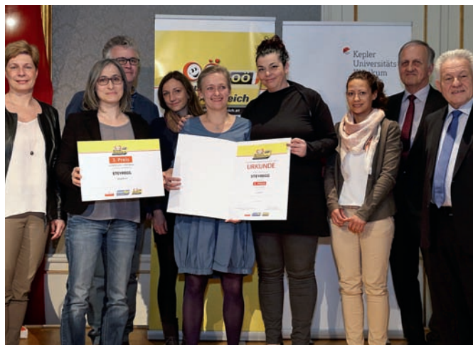
3. Preis auch für die „Gesunde Gemeinde Steyregg“.