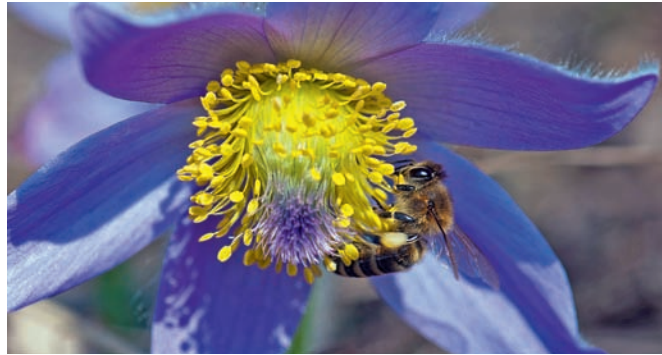
Bienen sind aus der heimischen Fauna nicht wegzudenken.

Mit Flyern, Veranstaltungen, Radiosendungen, Informativtafeln und anderen Medien macht die „Gesunde Gemeinde Freistadt“ seit Februar 2015 auf die Wichtigkeit von Bienen und Wildinsekten aufmerk-