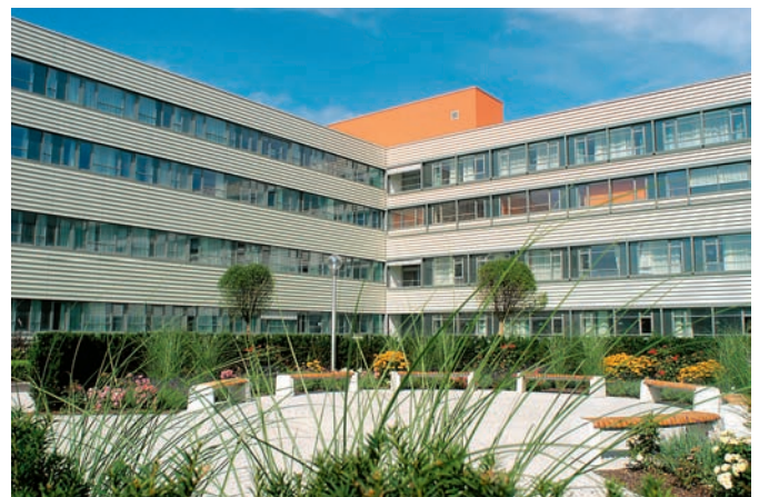
Investitionen im Gesundheitsbereich sichern eine optimale Gesundheitsversorgung und schaffen Wachstum.

Allein im Landesbudget 2016 stehen für Investitionen im Gesundheitsbereich insgesamt knapp 43 Millionen Euro zur Verfügung. Die gespag wird 2016 mehr als 32,6 Millionen Euro in ihre Krankenhäuser investieren. Vor allem durch die Vorbereitungen für den anstehenden Bau des Campusgebäudes werden sich die Investitionen der Kepler Univer-