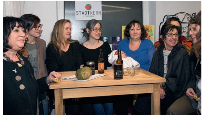
Ehrenamtliche Helferinnen vom Stadtkern Steyregg beim gemütlichen Austausch