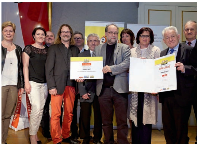
1. Preis für die „Gesunde Gemeinde Freistadt“.