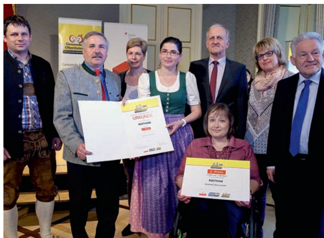
2. Preis für die „Gesunde Gemeinde Roitham“.