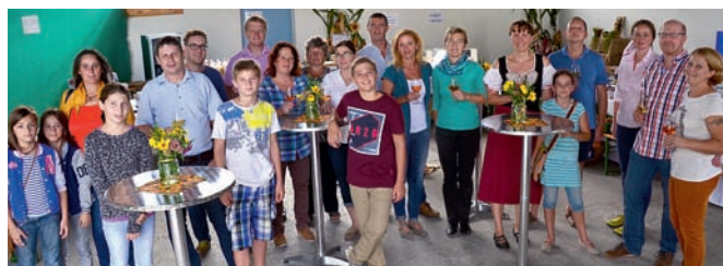
Groß ist die Freude über das gelungene Projekt bei Mitarbeitern und ihren Angehörigen.

ben unsere Einwohner die Möglichkeit, persönlich einen Beitrag zur eigenen Gesundheit zu leisten. Dies ist ein großes Anliegen unserer Gesunden Gemeinde. Durch unser Miteinander ist auch das „Roithamer Kisterl“ entstanden. Eine nette Geschenkidee für jeden Anlass, gefüllt mit Produkten aus Roitham.