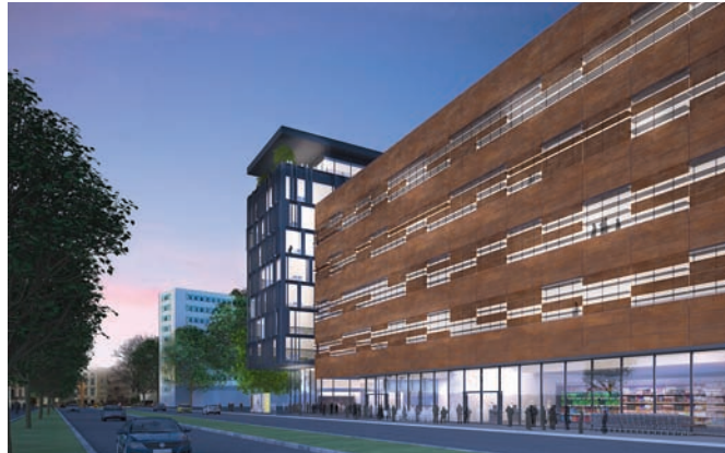
Die Fassade des Campusgebäudes zur Krankenhausstraße hin

Das Campusgebäude mit rund 12.500 m 2 Nutzfläche