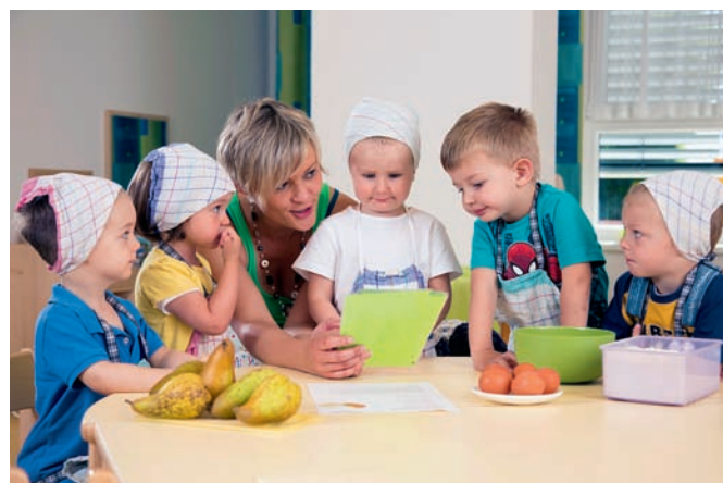
Abenteuer: gemeinsam kochen im Kindergarten

Auch die Gesunden Gemeinden versuchen, die Kindergärten in ihren Bestrebungen zur Gesundheitsförde-