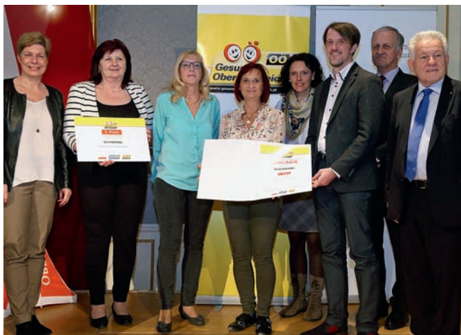
3. Preis für die „Gesunde Gemeinde Schärding“.